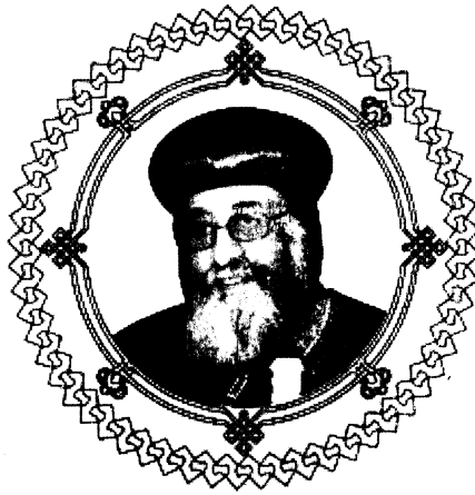
قداسة البابا توليوس الثاني بابا الإسكندرية ويطيريك الكرازة المرقسية